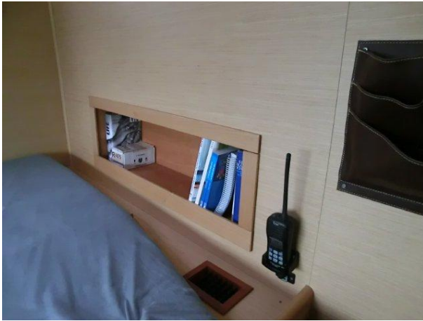
UKW –Funkgerät in jeder Kabine