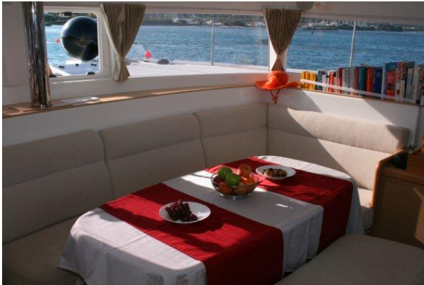
Tischwäsche im Saloon