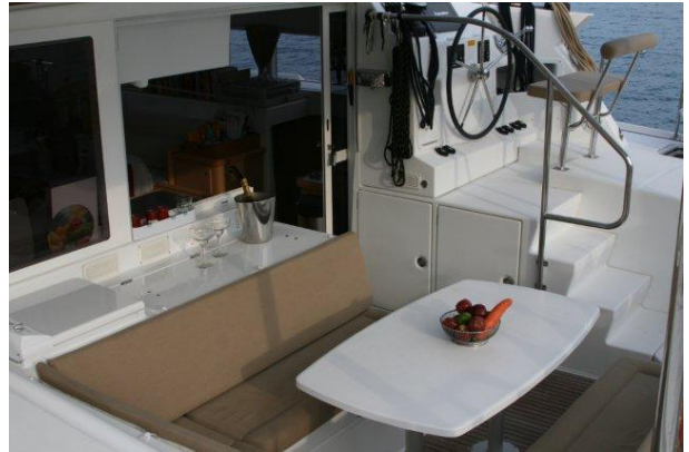
Cockpit und WaMa