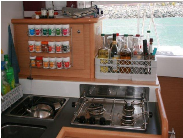
Gewürze, Essig + Öl immer vorhanden